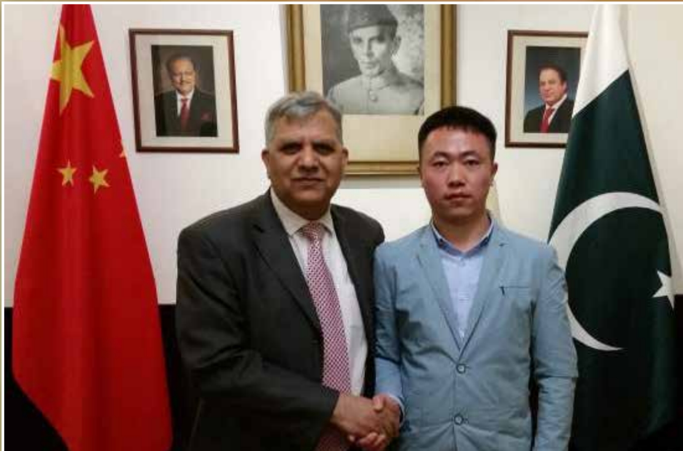
ඉදිරිපත් කිරීම : ෂෙං ලි