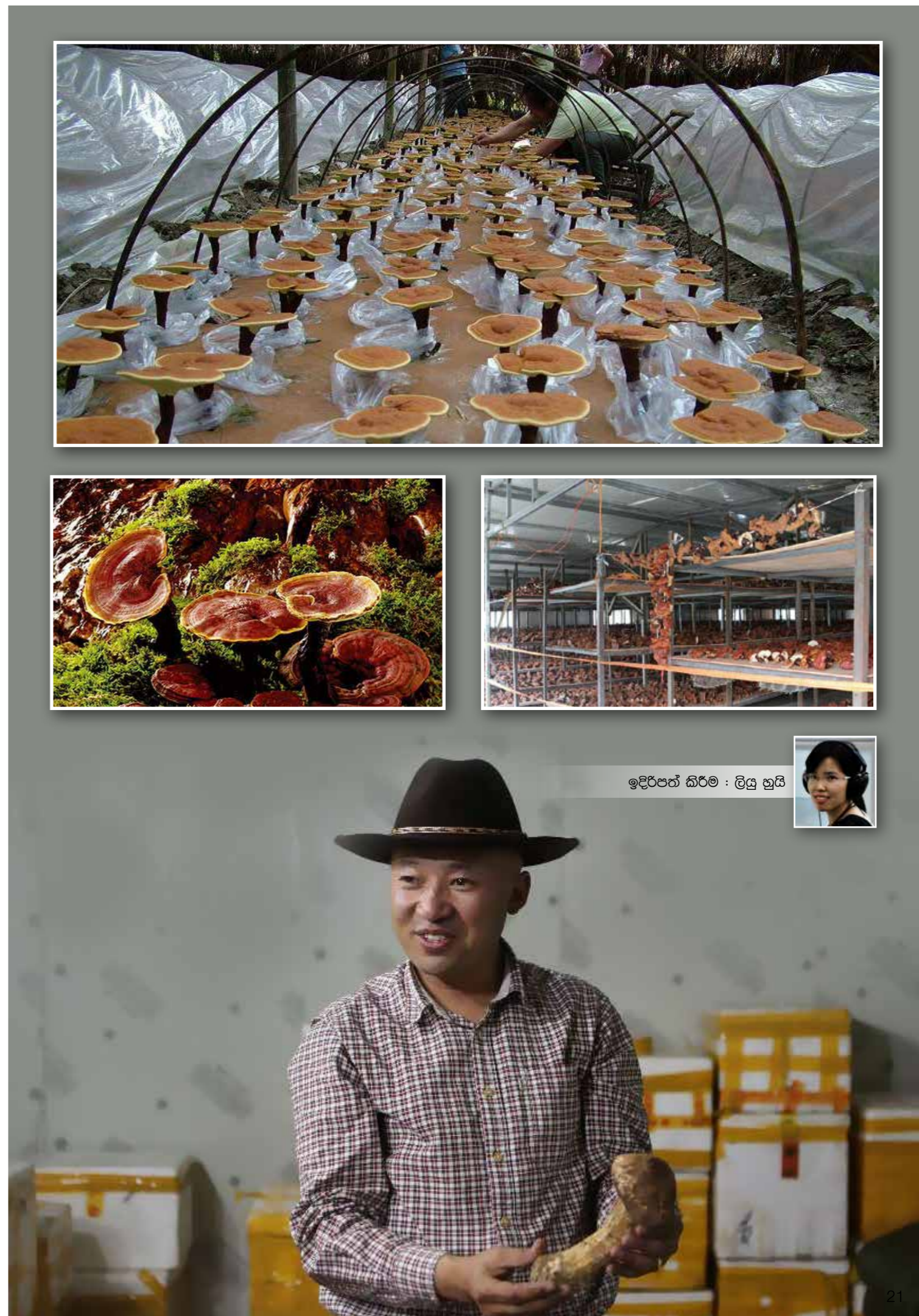
ඉදිරිපත් කිරීම : ලියු හුයි