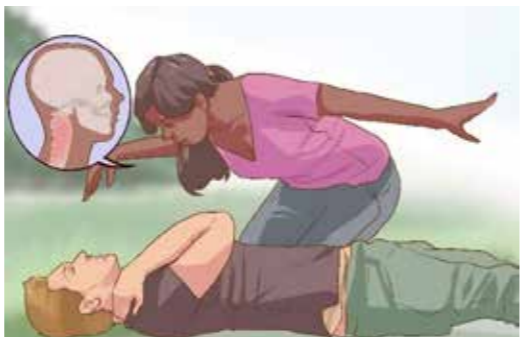
වැටී සිටින පුද්ගලයකු එකවර එසවීමෙන් වළකින්න. කොඳු ඇටපෙළට හානියක් වී ඇත්දැයි තක්සේරු කරගන්න.

රෝගියාගේ කොඳු ඇට පෙළෙහි අනතුරක් ඇති බවට තක්සේරු කර ගන්න. උඩකින් වැටීම, රිය අනතුරකට ලක්වීම, දැඩි ලෙස පහරක් වැදීම ආදී අවස්ථාවලදී රෝගියාගේ කොන්දෙහි වේදනාව, පාද සෙලවීමට අපහසුව හා දැනීම අඩුවීම ආදිය මගින් තහවුරු කරගත හැකිය. කොඳු ඇට පෙළට හානියක්දැයි සැකසහිත ඕනෑම අවස්ථාවක කශේරුවට හානි සිදු වී ඇතැයි බව උපකල්පනය කර අදාළ ප්‍රථමාධාරයට යොමු වන්න.