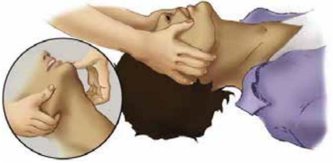
හකු අස්විය එසවීම මගින් ස්වසන මාර්ගය විවෘත කිරීම (Jaw Thrust Method)

ප්‍රථමාධාරකරු වාඩි වී රෝගියාගේ නිස වලනය නොවන පරිදි අල්ලා ගනිමින් කන් දෙපසින් දෙඅත්ල නබා ස්වසන මාර්ගය විවෘත කිරීමට හතුව ඇඟිලිවලින් ඔසවා අල්ලා ගන්න (Jaw Thrusts Method)