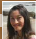
ඉදිරිපත් කිරීම : වං සිං