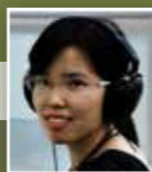
ඉදිරිපත් කිරීම : ලියු හුයි

මෙම කතාව චීනයේ ප්‍රස්ථා පිරුළක පසුබිම් කතාවය. 'යි මිං ජිං රෙන්' ලෙසය. බැලූ බැල්මට නිශ්ඡබිදව නිකරුණේ සිටින කෙනෙකු කවදා හෝ විශිෂ්ඨ දක්ෂකම් දක්වමින් එක්වරටම ලෝ අවධානයට ලක් වීම ඉන් කියැවේ.