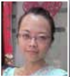
ඉදිරිපත් කිරීම : සුන් ජියා ජියා

2013 වසරේ ඒන ජනාධිපති ෂී ජින් පීං මහතා එක් තීරයක් එක් මාවතක් පිළිබඳ වැඩපිළිවෙළ ඉදිරිපත් කළේ ය. එය ලෝක සාමයට හා අදාළ රටවල්වල පොදු සංවර්ධනයට ඉමහත් රුකුලක් බව Chaoprakhunsomdej නායක හිමියන් පවසයි. 2015 වසරේ ඒන - තායිලන්ත රාජ්‍යාණ්ඩුක සබඳතාව ස්ථාපිත කිරීමේ 40 වන සංවත්සරය යෙදී තිබේ. එම අවස්ථාව ප්‍රයෝජනයට ගනිමින් උන් වහන්සේගේ පෙළඹවීම මත ඒන ටියැන්ජිං ගුරු විශ්ව විද්‍යාලය සහ තායිලන්ත විශ්වවිද්‍යාල ඇතුළු අධ්‍යාපන ආයතන 26ක් එකතු වී ලෝකයේ ප්‍රථම මුහුදු සේද මාවතේ කොන්ග්ලිප්පියස් ආයතනය ආරම්භ කර තිබේ.