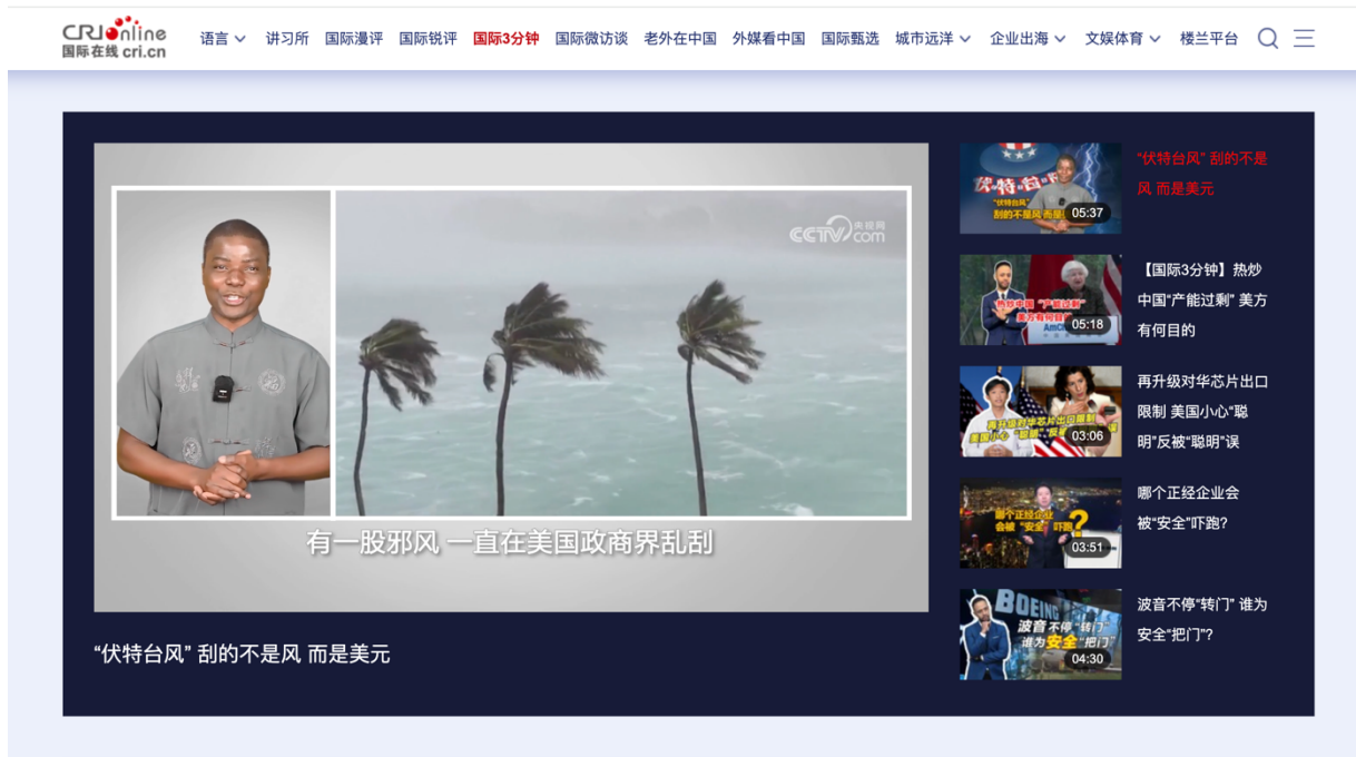
上半年代表作首屏截图